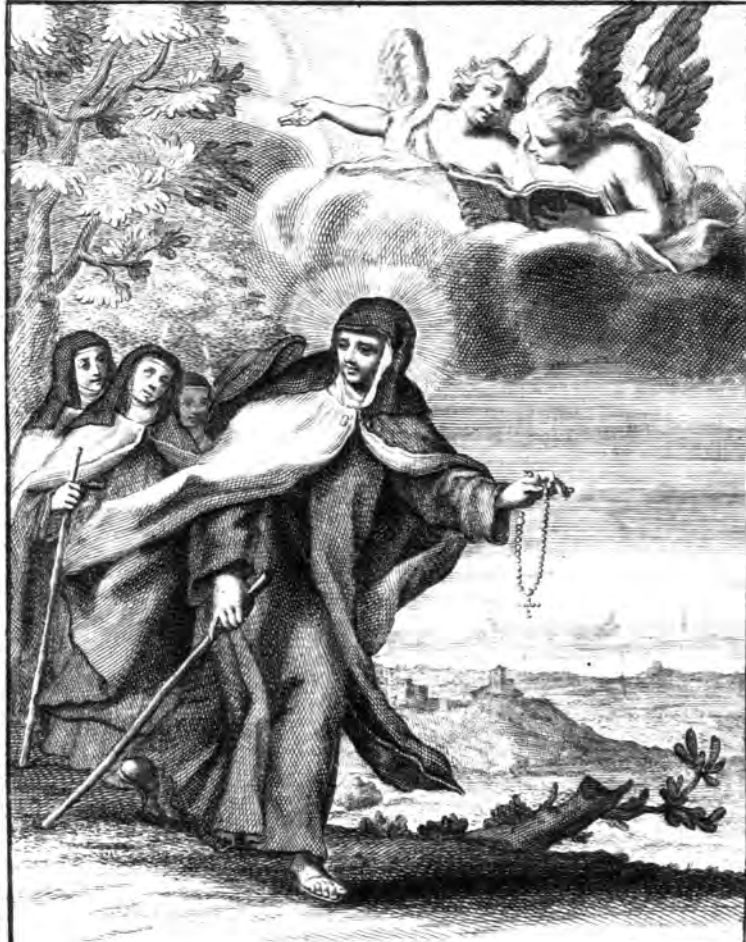
S. V. Theresia hominum inter Ludibria pro Carmeli instauracione desudans Angelico cantu collau- datur. Arnold. F. Westerhout Scul.