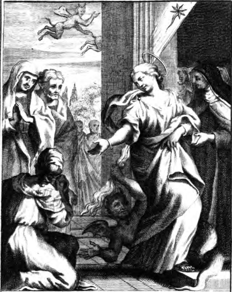
S. Teresia Mundi illecebris, ac Daemonis artibus forti animo despectis Carmeli ordinem lucidissimo sydere præsignata ingreditur.