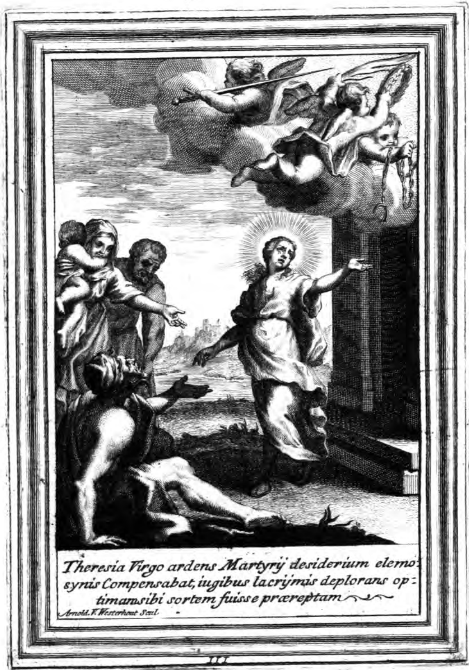
Theresia Virgo ardens Martyrij desiderium elemo- synis Compensabat, iugibus lacrymis deplorans op- timam sibi sortem fuisse praeceptam